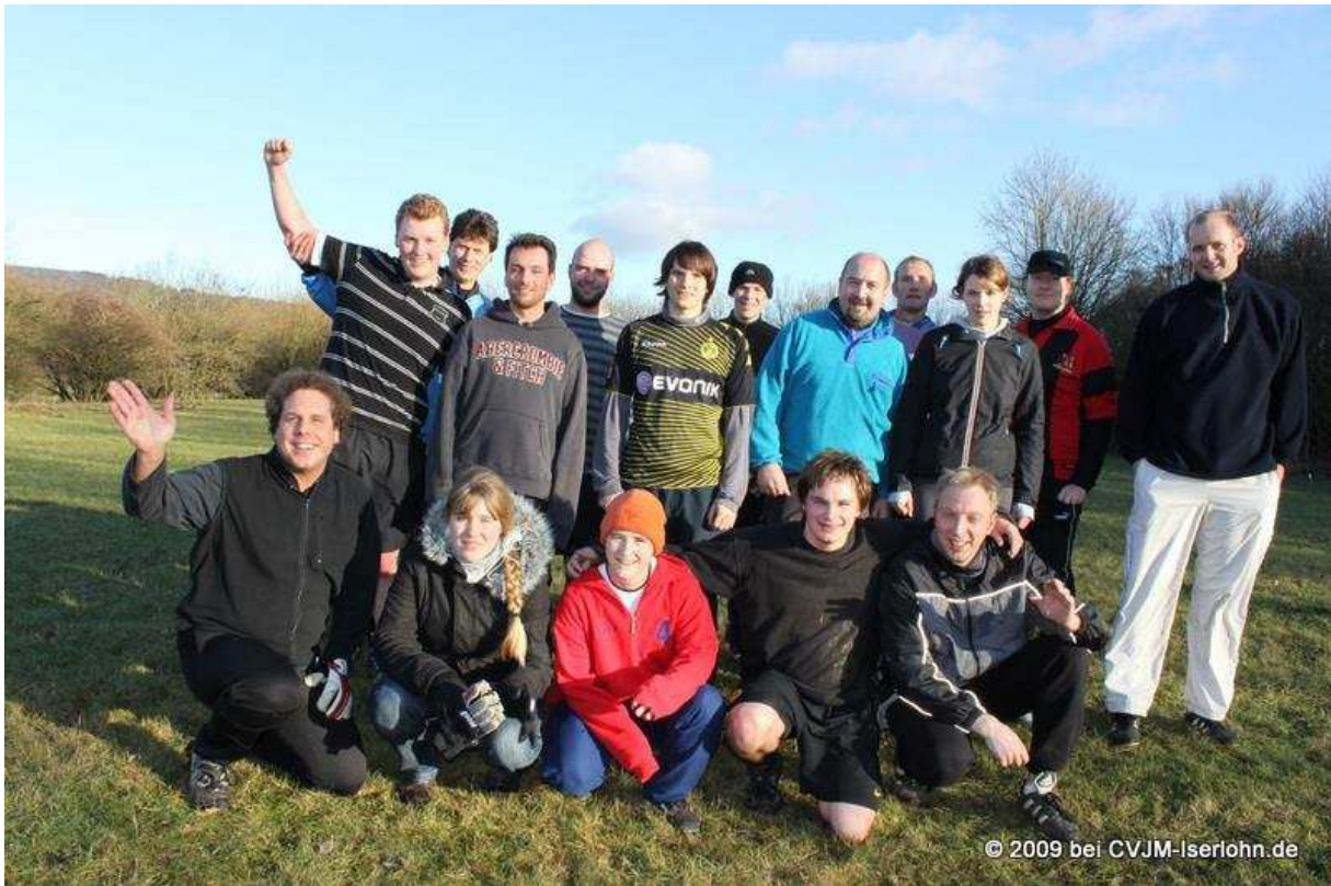
Fußball nach dem Agapemahl Weihnachten 2009