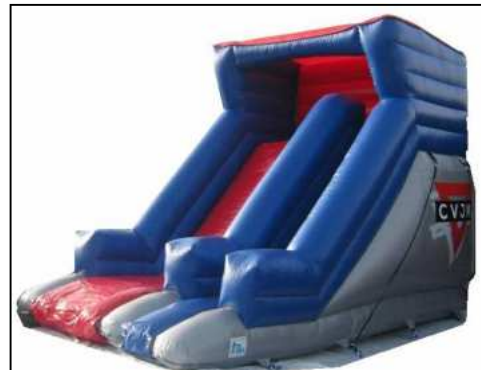
Aktions- Gerät „Riesen- Rutsche“