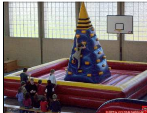
Aktions- Gerät „Kletter- Berg“