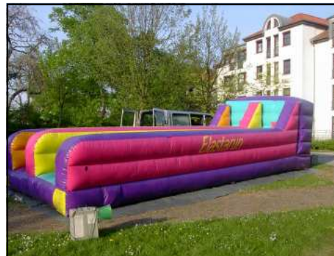
Aktions- Gerät „Elasta- Run“