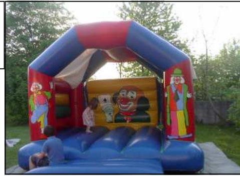
Kinder- Hüpfburg „klein“ + „groß“