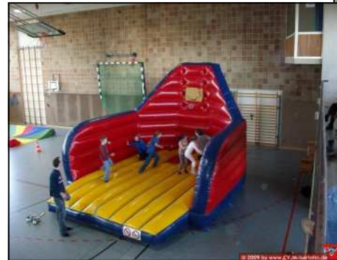
Aktions- Gerät „Bask“